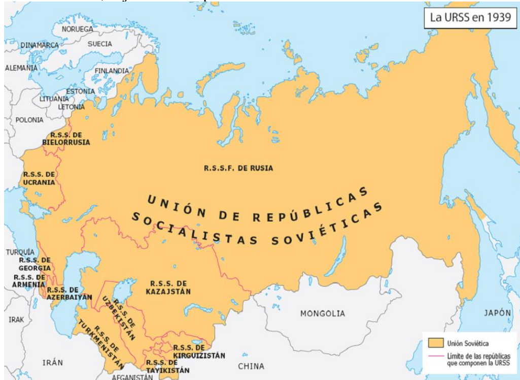
Figura 1: Mapa de los territorios pertenecientes a la Unión de Repúblicas Socialistas Soviéticas antes de su desintegración. (History & Maps, 2015).

pertenecientes a la Unión. El Secretario General y fundador de la Unión fue Vladimir Lenin, quien murió en 1924, dejando a Joseph Stalin al mando de la misma.