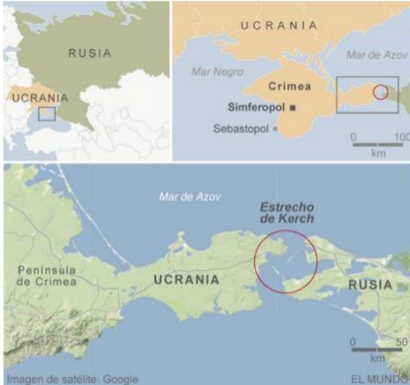
Figura 2: Mapa que indica la ubicación del Estrecho de Kerch, donde estará ubicado el puente que conectará Rusia y la Península de Crimea. (El Mundo, 2014).

En 2014 se publicó un nuevo plan infraestructural de Rusia que se llevaría a cabo un año después; este consiste en la construcción de un puente sobre el estrecho de Kerch para unir la Península de Crimea con el territorio ruso. Vladimir Putin califica esta hazaña como histórica, pues estaba planeada desde 1910. Se infiere que el puente estará funcionando en 2018, para facilitar la comunicación de estos dos territorios.